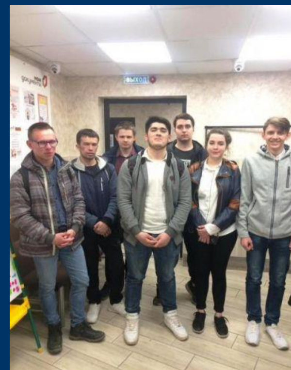
На экскурсии в МФЦ