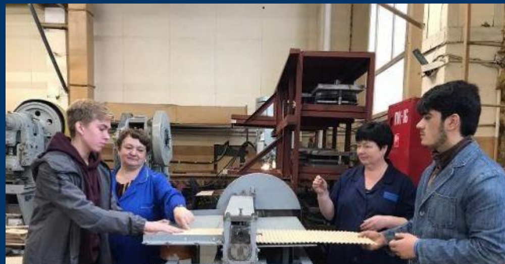
День без турникетов на заводе «Энергия»