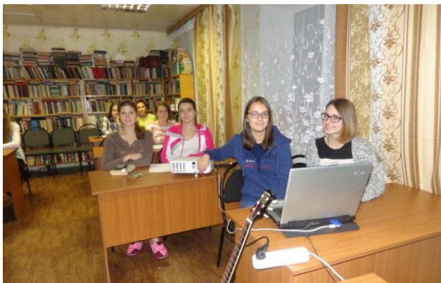
Вечер в комнате отдыха общежития №3

3 октября 2015 года Россия и весь мир отмечали 120-летие со дня рождения русского поэта Сергея Есенина. По этому случаю в красном уголке студенческого общежития было принято решение провести вечер, посвященный этой дате.