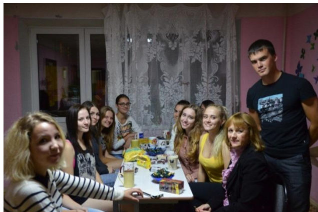
Чаепитие во 2 секции 2 этажа

Хочется больше общения, друзей и просто знакомых. Специально для этого 1 октября проводилось чаепитие в секциях второго этажа общежития №3.