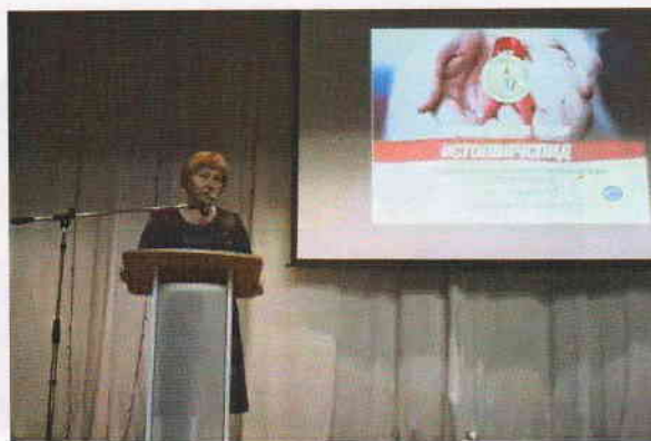
Участников и гостей Форума приветствует проректор по воспитательной и социальной работе, кандидат педагогических наук

Всероссийская акция «СТОП ВИЧ/СПИД», приуроченная ко Всемирному дню памяти жертв СПИДа 21 мая, проводится по инициативе Фонда социально-культурных инициатив под патронажем президента фонда С. В. Медведевой. В период с 15 по 21 мая 2017 г. в рамках всероссийской акции в Гжельском университете запланировано проведение ряда мероприятий, в числе которых II региональный форум «Остановим СПИД вместе!», конкурс рисунков и плакатов, обновление информационных стендов, кураторские информационные занятия, видеолектории, тестирование на ВИЧ, участие в онлайн-трансляции стратегической сессии для студентов «Молодежь России против ВИЧ». Студенты отделения дизайна колледжа ГГУ приняли активное участие в акции.