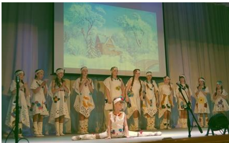
Студия моделирования «Одежда как творчество» Центра развития «Vivat» г. Киржач Владимирской области. Коллекция «Зимние забавы»