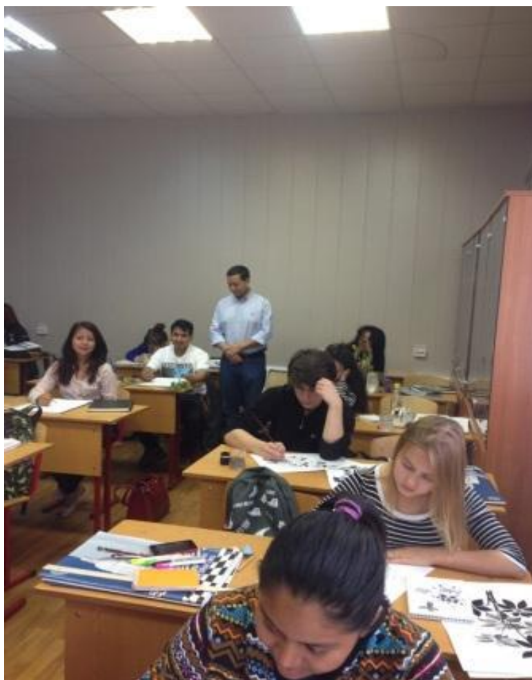
Мэр г. Панчималько посетил занятия студентов