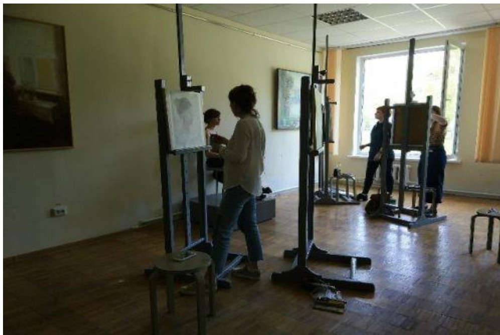
Выполнение рисунка с натуры