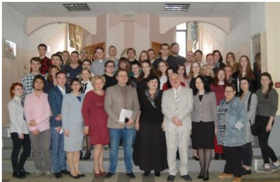
Участники конференции «Экономика и управление в условиях кризиса»