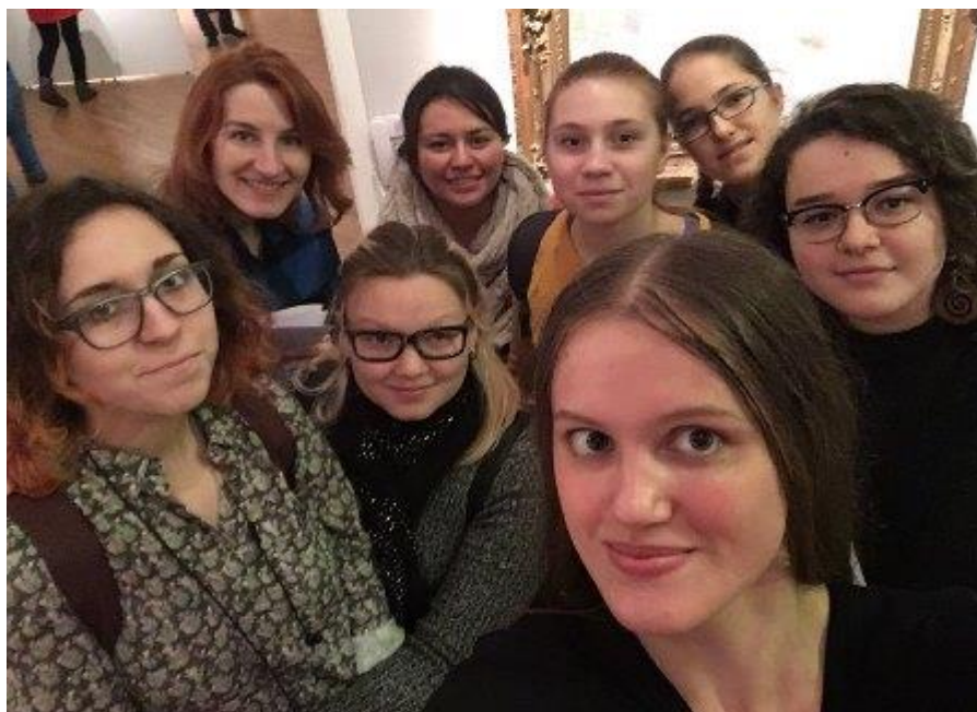
Студенты в музее