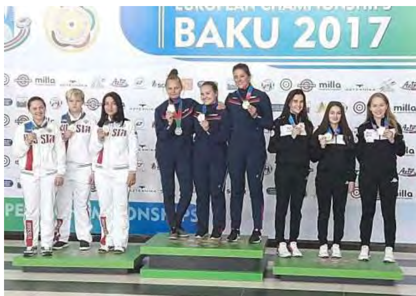
Первенство Европы по стрельбе из малокалиберного оружия в Баку (Азербайджан). Серебряная медаль в командных соревнованиях