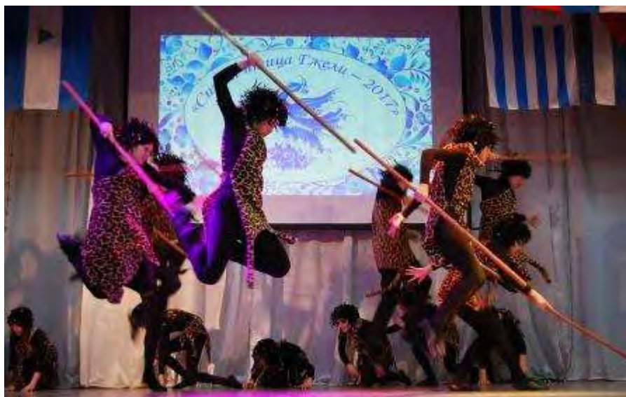
«Голос планеты. Африка» – с таким необычным танцем выступил хореографический коллектив «ТОТ» негосударственного учреждения дополнительного образования «Психологический центр “ТОТ”» из г. Москвы