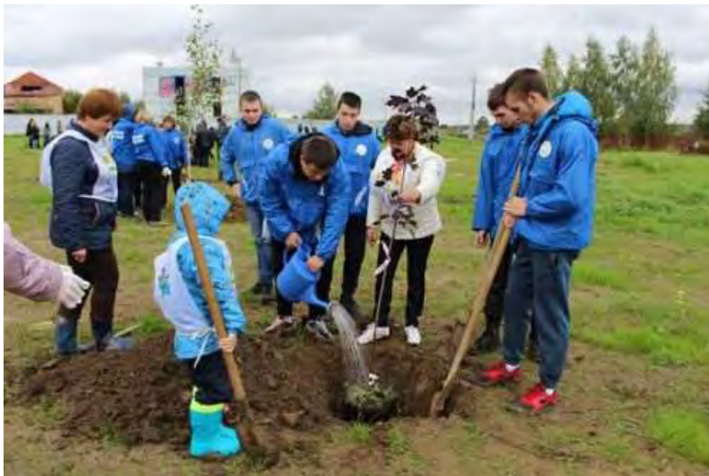
Здесь будет сквер