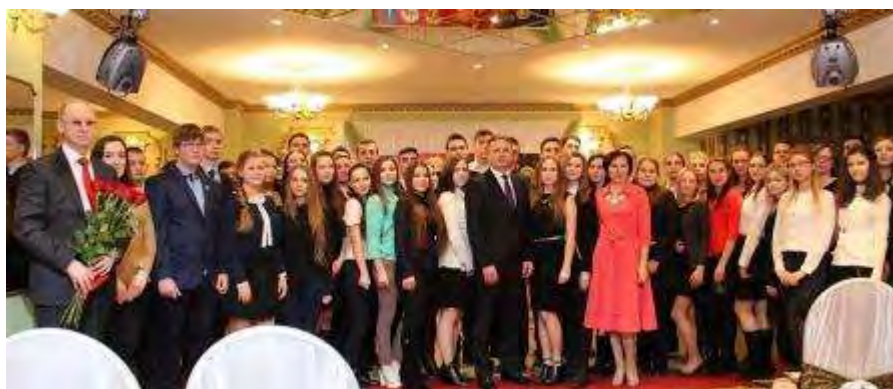
Студенты ГГУ – стипендиаты главы администрации Раменского района на празднике по случаю Дня российского студенчества