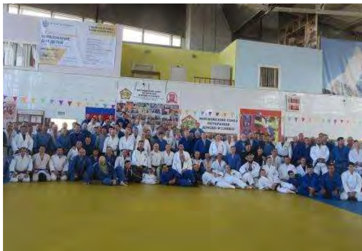
Участники VI открытого чемпионата Москвы по дзюдо среди ветеранов