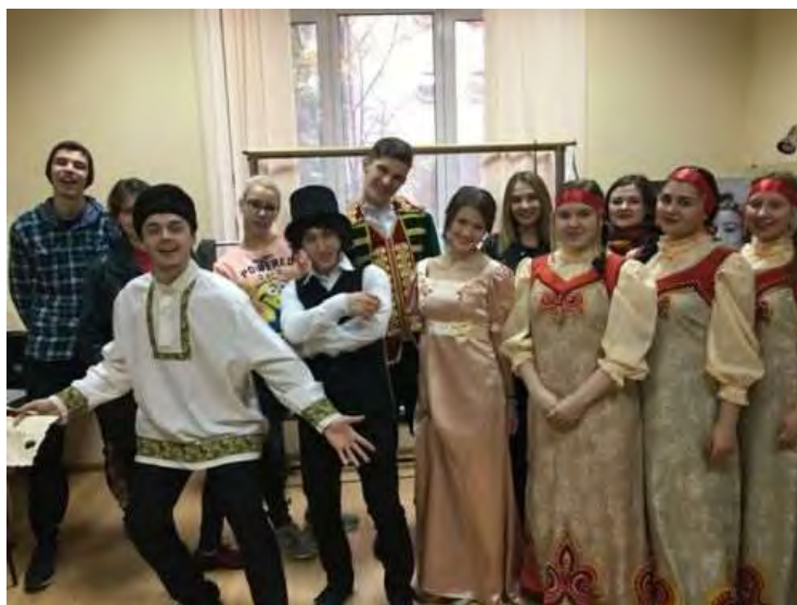
Артисты театра-студии СТЕП после выступления

проректор по воспитательной и социальной работе, кандидат педагогических наук