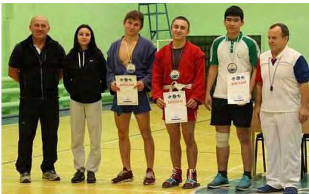
Награждение самбистов в весе до 62 кг