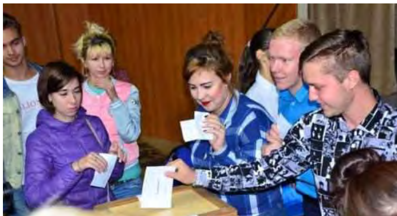
Студенты ГГУ выбирают председателя объединенного совета обучающихся

Отдел воспитательной и социальной работы