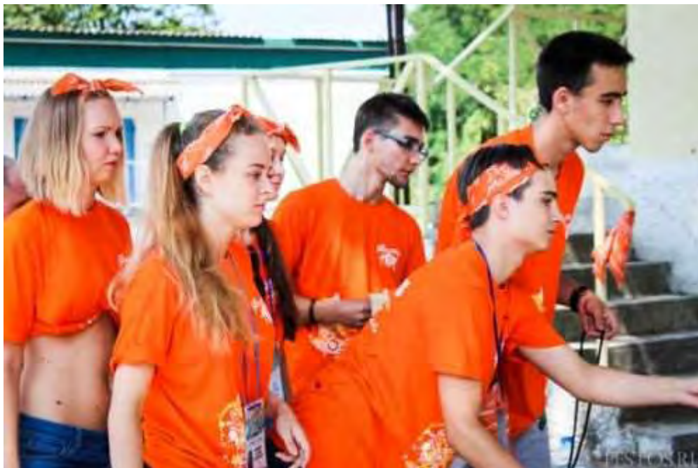
Деловые игры сплотили команду