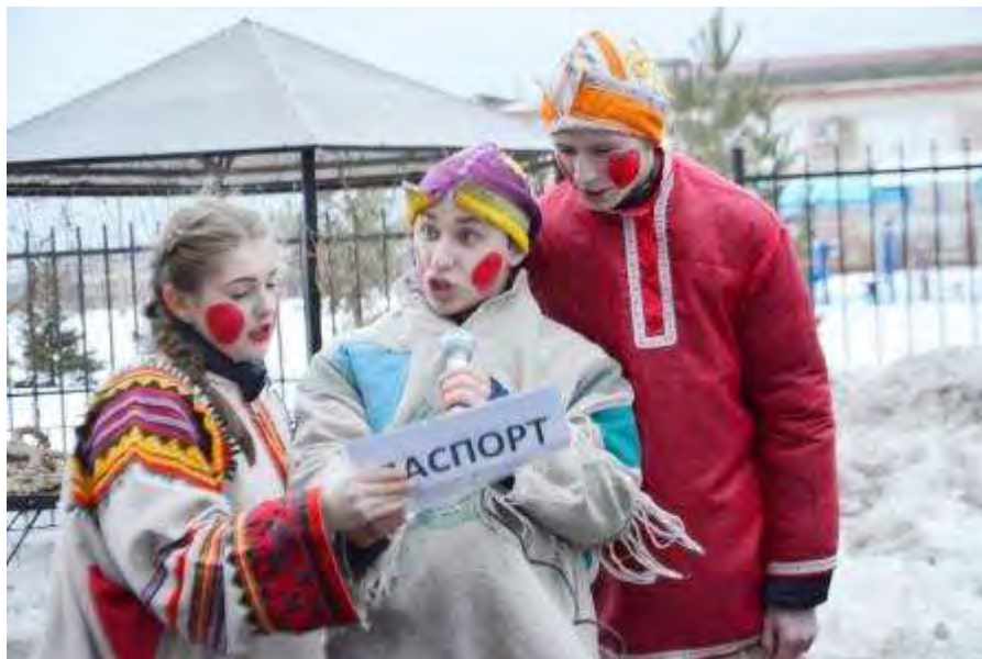
Веселые скоморохи заывают на праздник