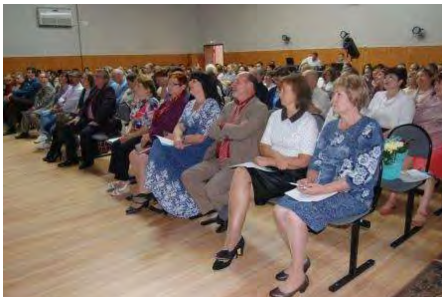
Во время конференции