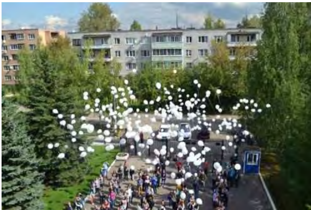
Белые шары – в память о жертвах трагедии в Беслане