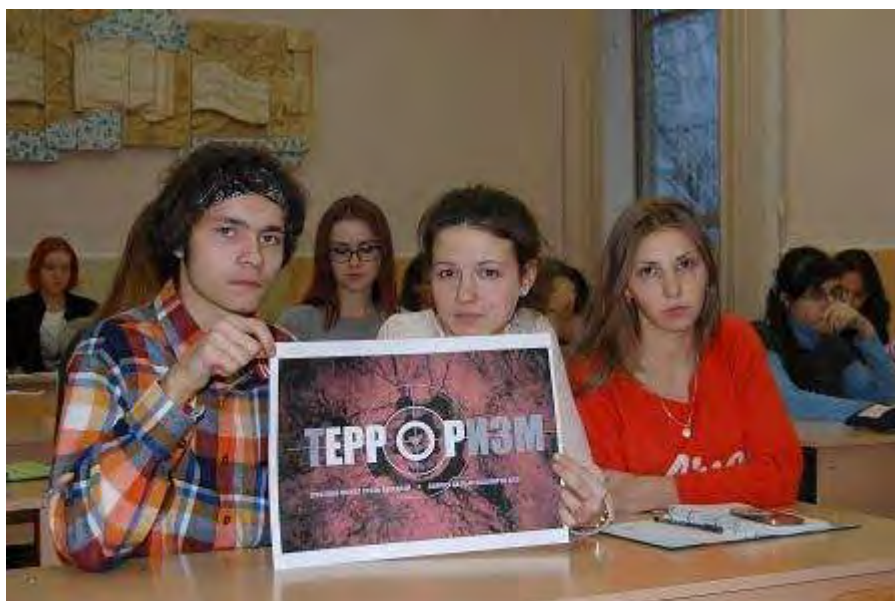
Студенты ГГУ против терроризма