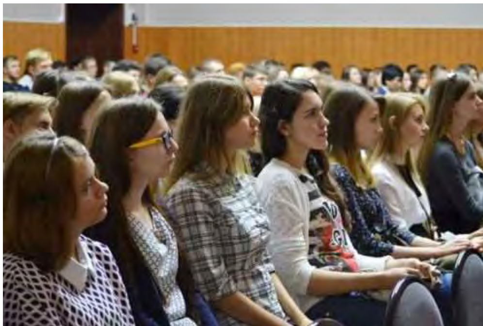
Первокурсники познакомились с историей и деятельностью университета

Отдел воспитательной и социальной работы