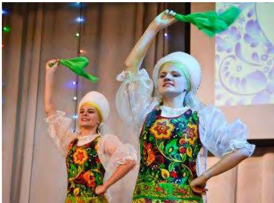
Выступает танцевальный коллектив «Егоза» из Бронницы