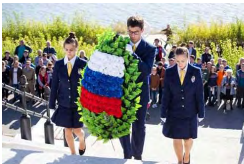
Участники форума возложили венок к мемориалу, созданному в память о соединении войск Юго-Западного и Сталинградского фронтов, завершивших окружение немцев под Сталинградом осенью 1942 г.