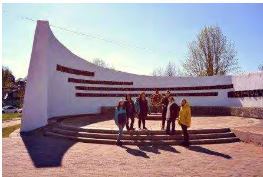
Памятник героям Отечественной войны