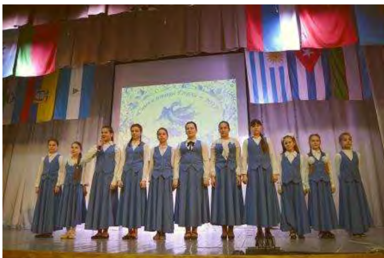
Хор средней школы № 15 с русским этнокультурным компонентом, г. Жуковский