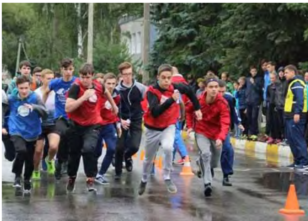
Старт юношей на дистанцию 1000 м