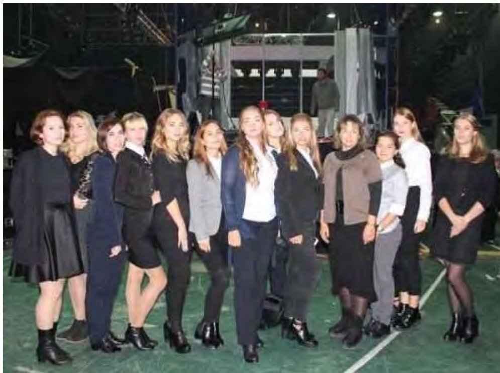
Студенты ГГУ приняли участие в программе центрального телевидения «Поединок»