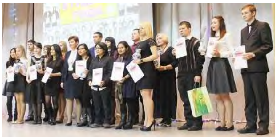
Лауреаты и дипломанты Международного фестиваля национальных культур «Мы учимся в России»