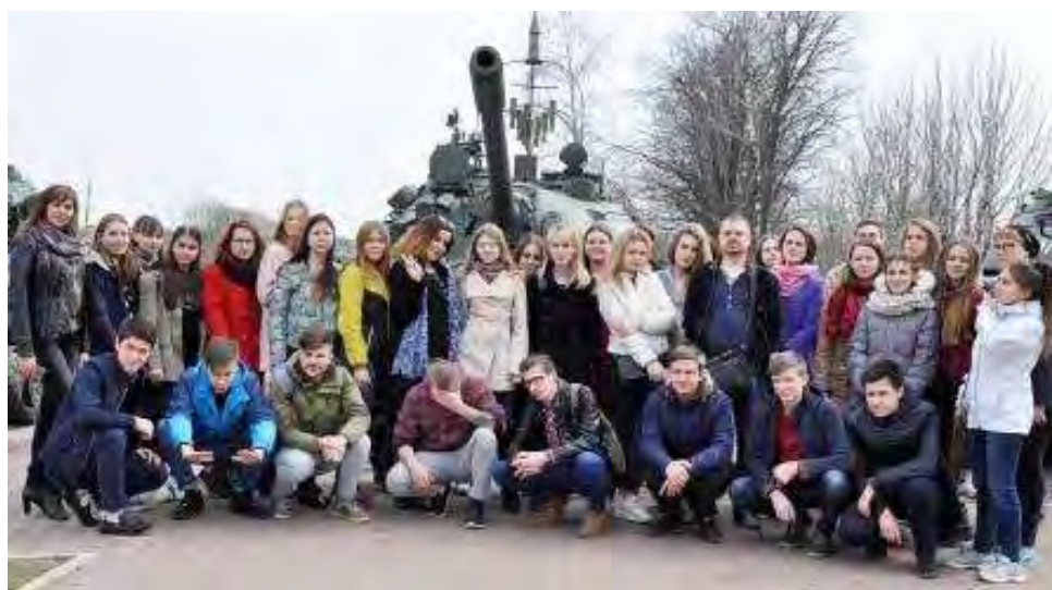
Поездка студентов ГГУ по местам воинской славы. Дмитров