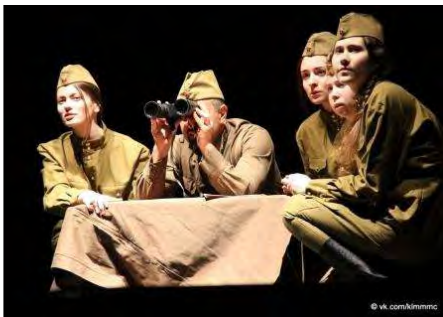
Коломна. Фестиваль «Студенческая весна Подмосковья – 2017». Театр-студия СТЕП выступает со спектаклем «А зори здесь тихие...»