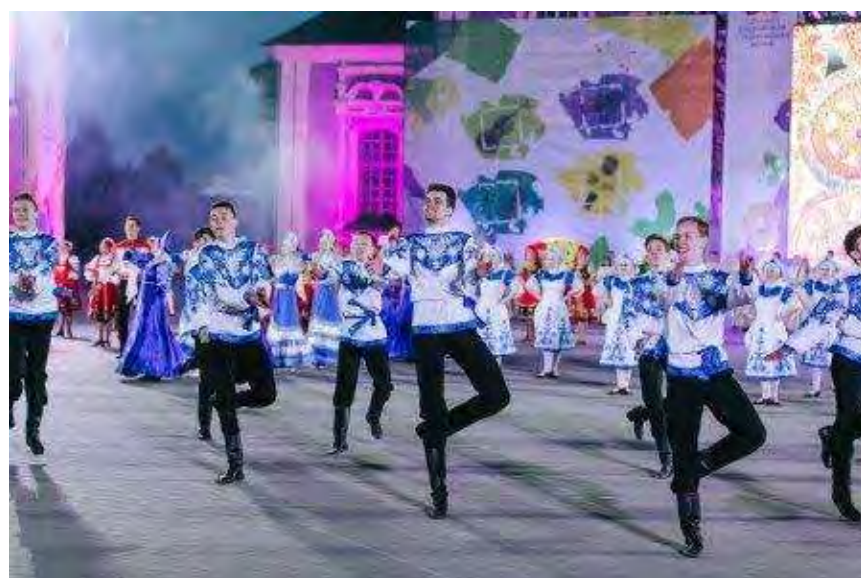
Гжель – российский бренд!