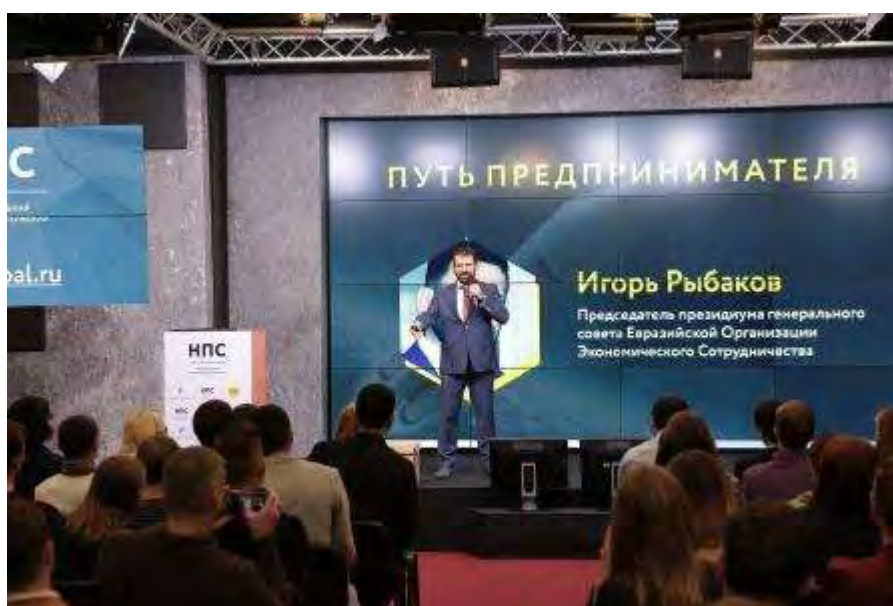
Финальная встреча участников проекта «Время действовать»