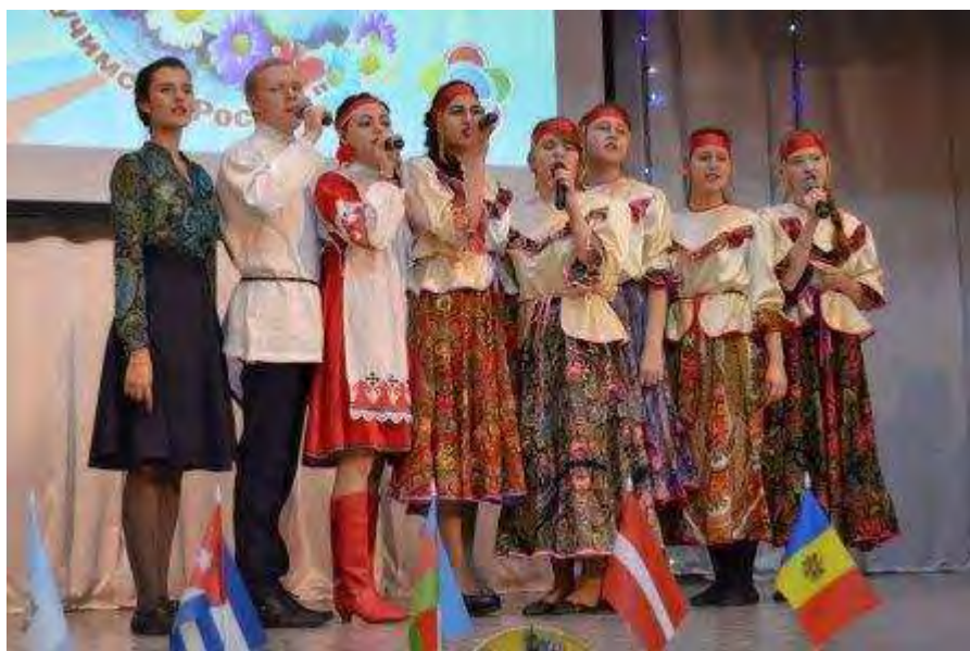
Солисты вокальной студии «Волна» на Международном фестивале «Мы учимся в России»