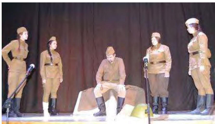
Сцена из спектакля «А зори здесь тихие...» в исполнении артистов студенческой театральной студии СТЕП