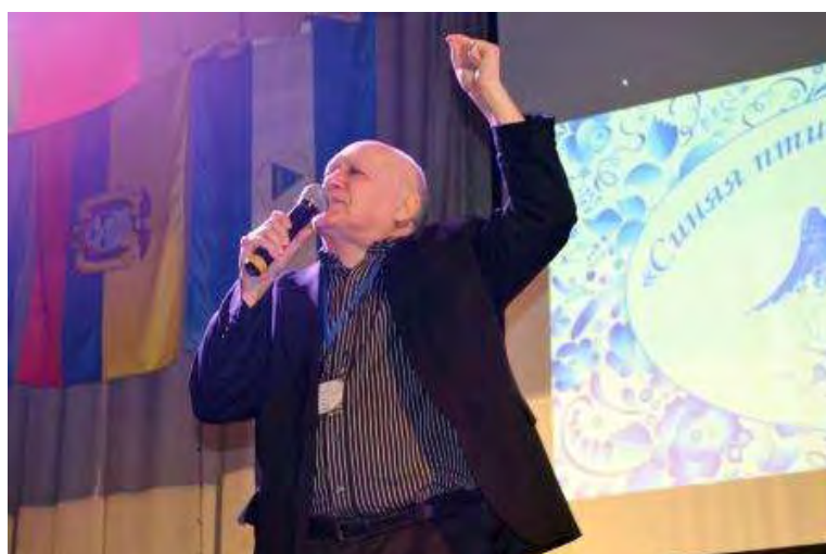
Председатель жюри конкурсной концертной программы, музыкант, композитор, заслуженный деятель культуры Белорусской ССР, народный артист Республики Беларусь Э.С. Ханок исполнил авторскую песню «Служить России»