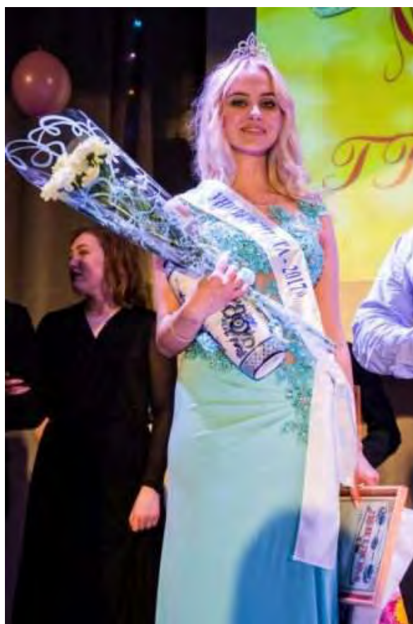
Победа в конкурсе «Мисс и мистер университета»