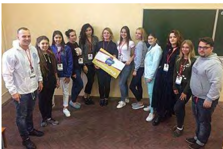
Команда, разрабатывающая программу для Калининграда, в состав которой входили студентки Гжельского университета