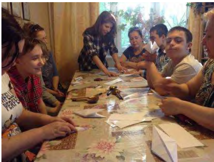
Урок оригами в Раменском отделении Всероссийского общества инвалидов

Отдел по воспитательной и социальной работе