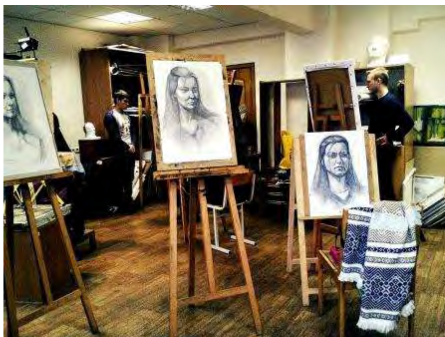
На занятиях по живописи