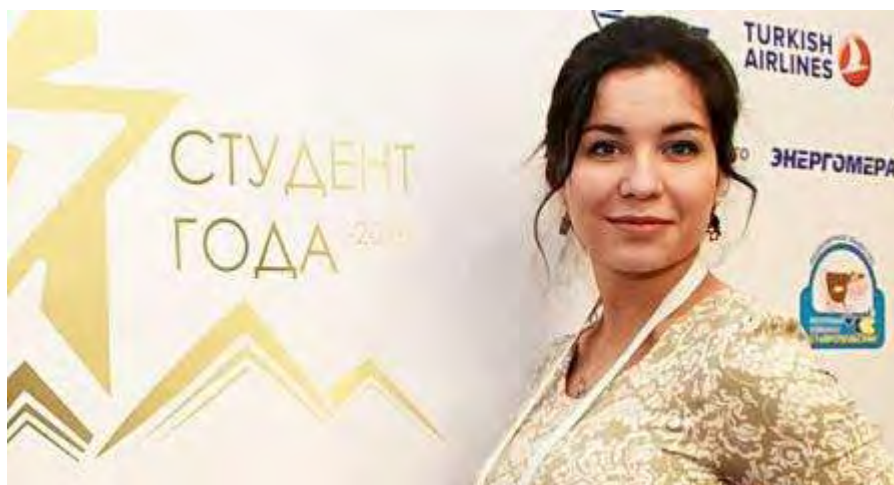
В финале Российской национальной премии «Студент года» в Ставрополе