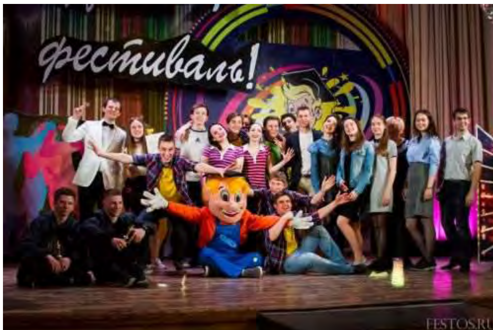
Лауреаты Всероссийского фестиваля студенческого творчества «Фестос – 2017»