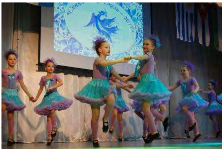
Танцевальная композиция «Озорная тучка» в исполнении хореографического коллектива «Пластин» учреждения дополнительного образования «Фантазия» г. Воскресенска