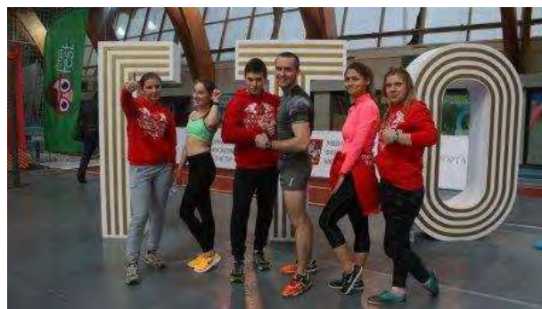
Команда Гжельского государственного университета на открытии фестиваля