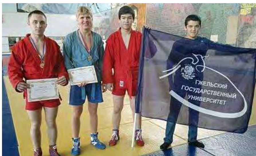
Самбисты спортклуба ГГУ на открытом чемпионате по самбо