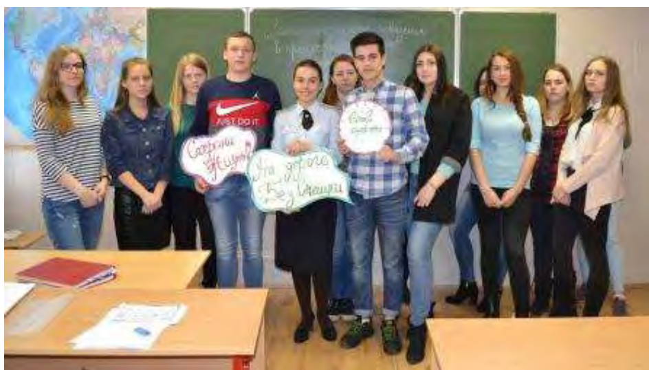
Студенты – участники фото-флешмоба с символами всероссийской акции «#Сохрани жизни!#Сбавь скорость»