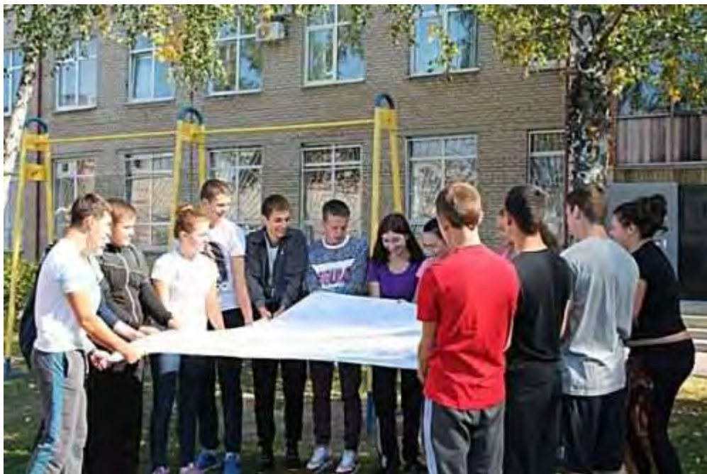
Одно из упражнений