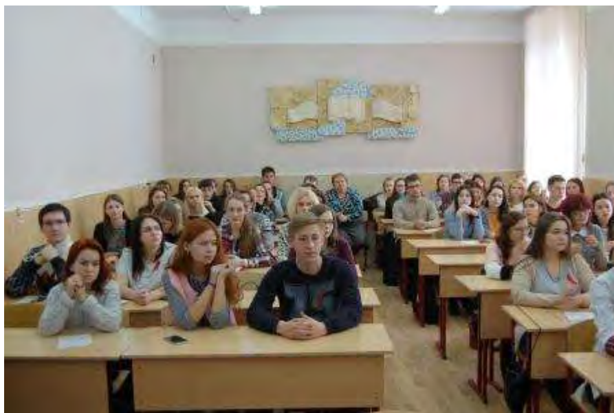
Участники круглого стола

Отдел воспитательной и социальной работы