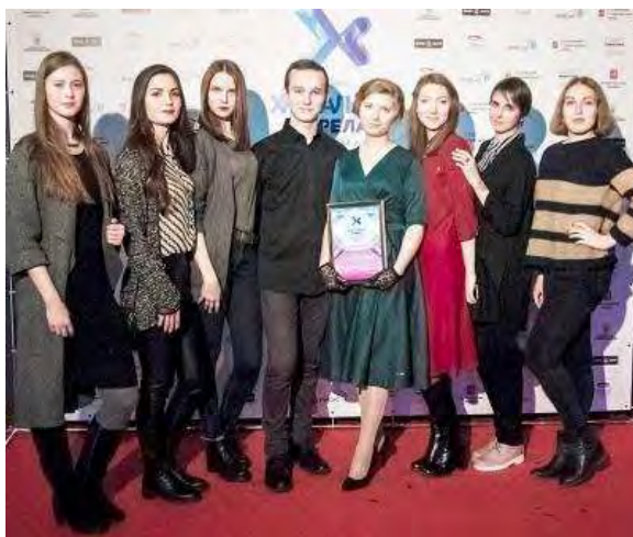
Студенты Гжельского университета на торжественной церемонии вручения наград Всероссийского конкурса «Хрустальная стрела»