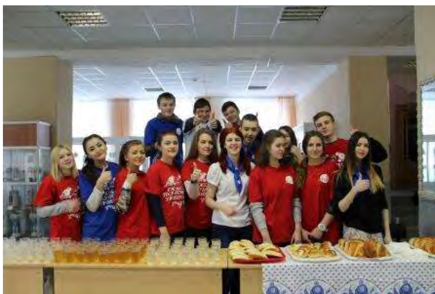
Все готово к угощению!