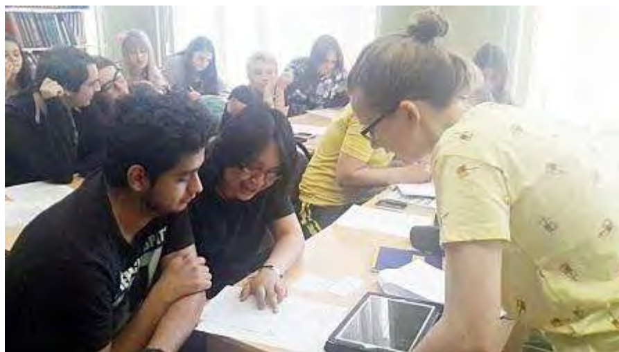
Студенты из Гватемалы выполняют задания викторины на знание славянской азбуки