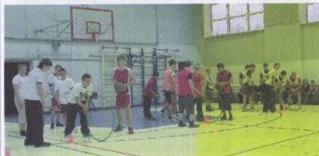
Один из этапов соревнований