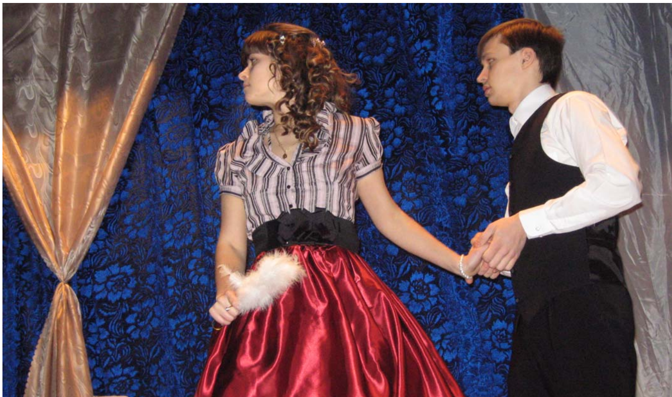
Весенняя премьера в театре-студии «СТЕП» см. стр. 7