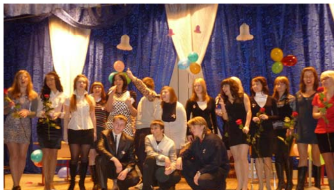
Вот они – выпускники! (на сцене студенты 47 группы)

Надо сказать, подготовка к этому важному и знаменательному дню, как для нашей группы, так и для отделения туризма вообще, потребовала немало времени, сил и нервов. Были истрочены тонны бумаги, километры фотопленки, килограммы косметики и лака для волос. Нами и не только нами, а точнее – вообще не нами была подготовлена программа вечера. Свою лепту в этот праздник внесли каждая группа и каждый преподаватель! Так, например, первокурсники подготовили вокальный номер под живой аккомпанемент. Ребята же постарше, организовали отличный розыгрыш с шарами, в итоге которого каждый из нас нашёл своё «будущее призвание». И получилось, что у одного назначение в жизни стать матерью – героиней, у другого – уехать во Францию или Австрию, у третьего же – открыть рекламное агентство. Видимо, многие верят в нас, в наше успешное будущее, и, может быть, даже рассчитывают на нашу помощь в дальнейшей жизни.