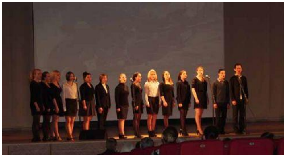
Выступает вокальная студия «Созвездие»

Поздравляем победителей конкурса с прекрасным выступлением!