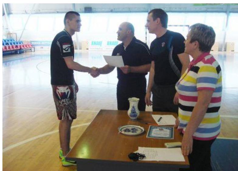
Гжельские сувениры для победителей