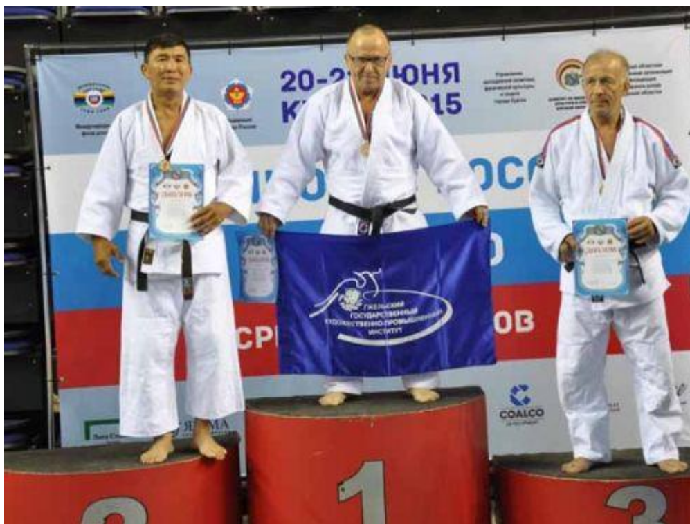
Награждение победителей на чемпионате России по дзюдо