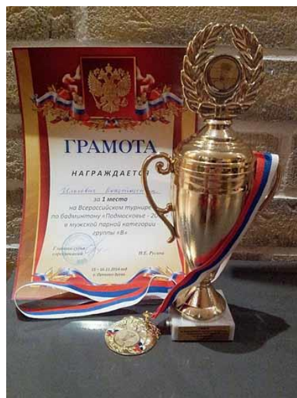
Спортивные трофеи мастера спорта по бадминтону К. Б. Илькевича во Всероссийском турнире «Подмосковье-2014»