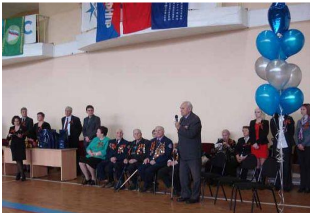
Выступление ветеранов Великой Отечественной войны перед началом соревнований