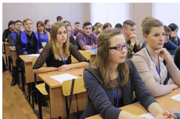
Участники форума на секции "Актуальные проблемы формирования толерантности в молодежной среде"