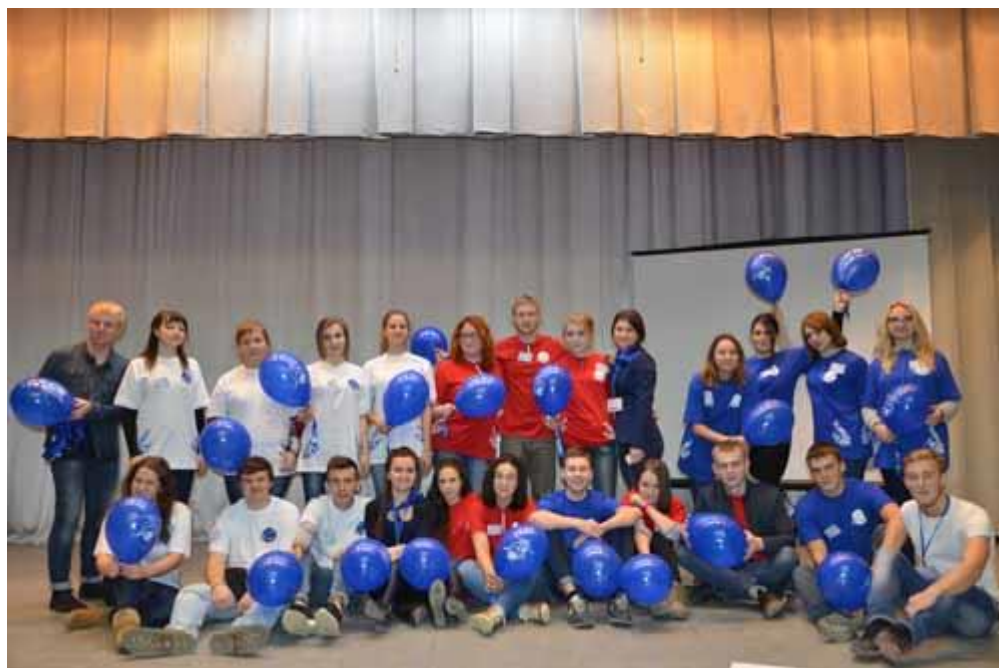
Участники III межвузовской школы студенческого актива Продвижение