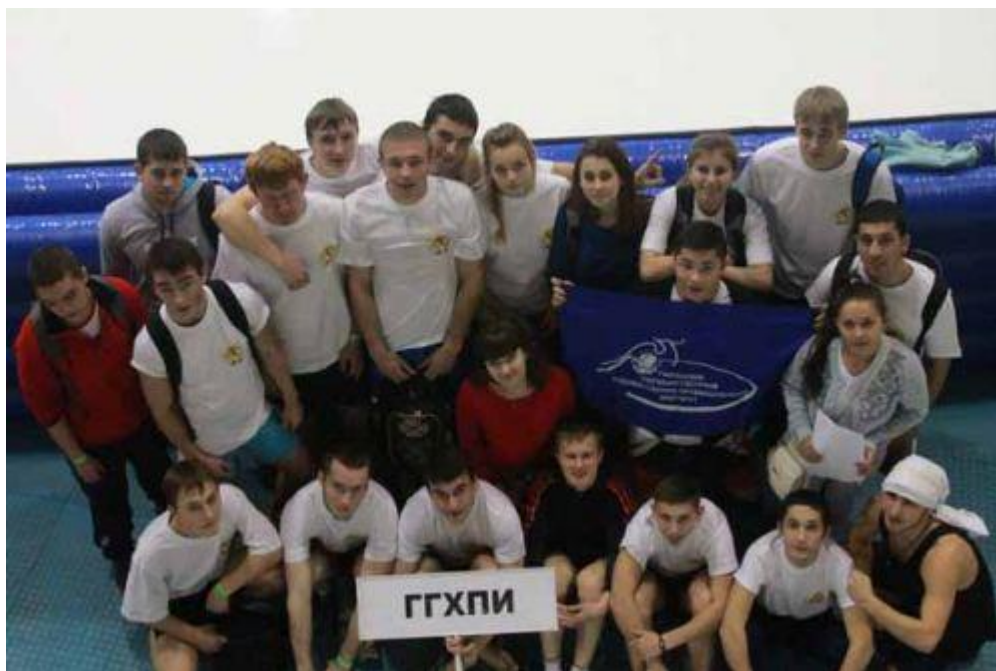
Команда ГГХПИ лидер Всероссийского фестиваля Готов к труду и обороне