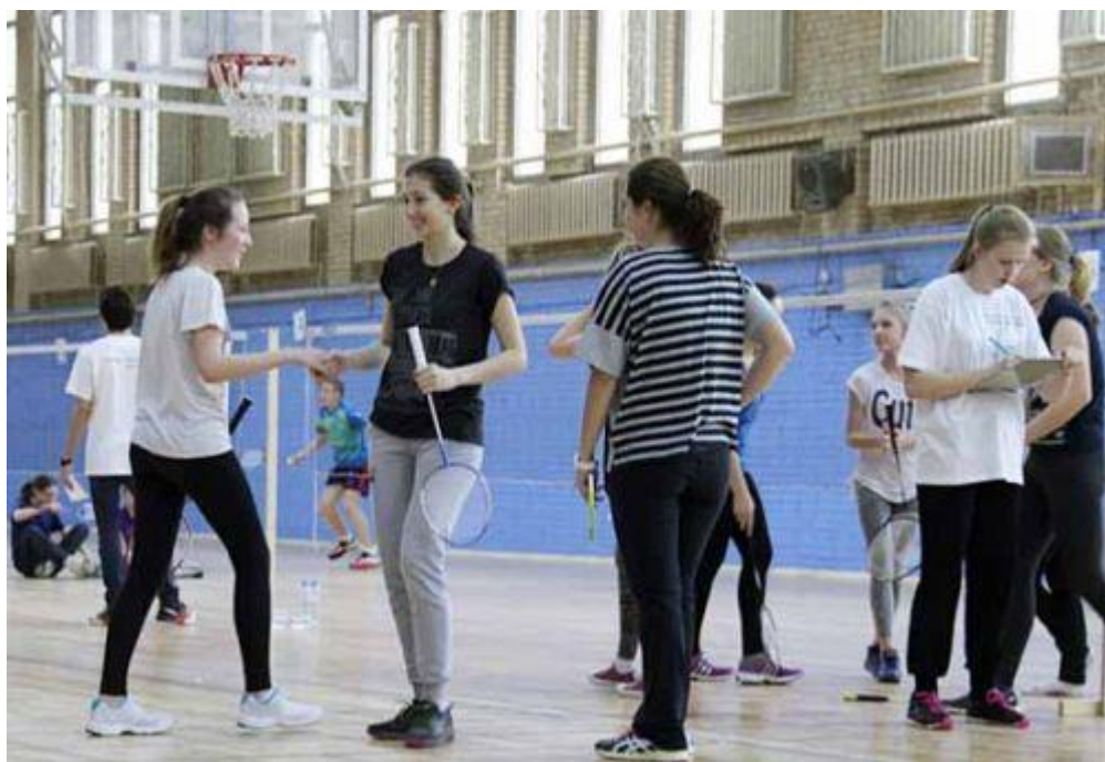
Во время соревнований