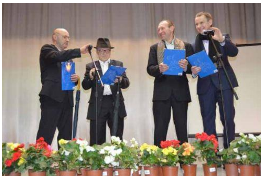
Джентельмены кафедры физической культуры и безопасности жизнедеятельности