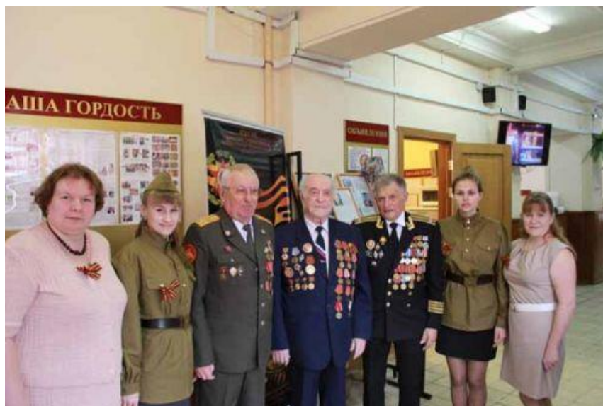
Студенты и преподаватели ГГХПИ с ветеранами Великой Отечественной войны