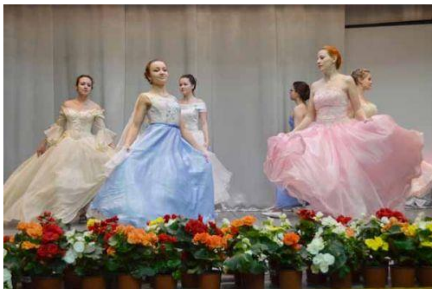
Студия бального танца «Глория» исполняет «Весенний вальс»