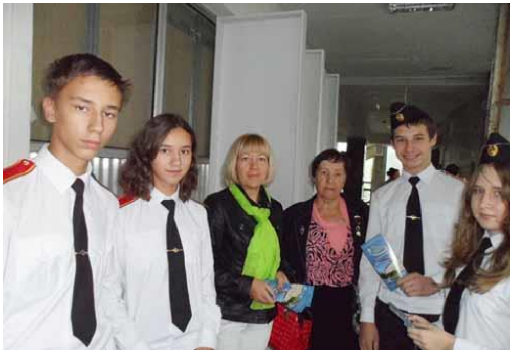
Раменские школьники хотят больше знать о нашем институте