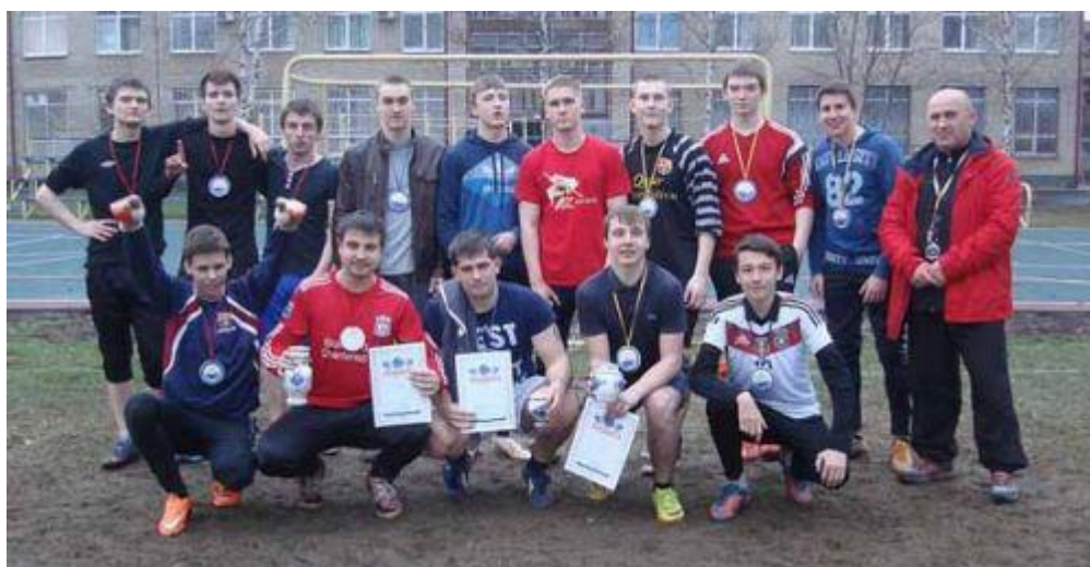
Победители турнира ГГХПИ по мини-футболу