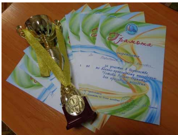
Награды нашей команды в первенстве по военно-прикладному многоборью