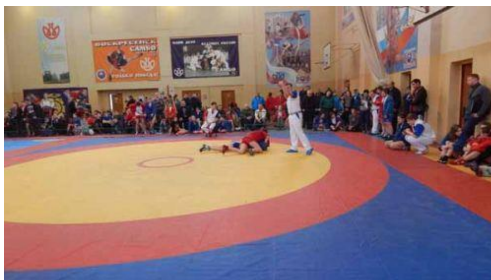
Болеем за наших