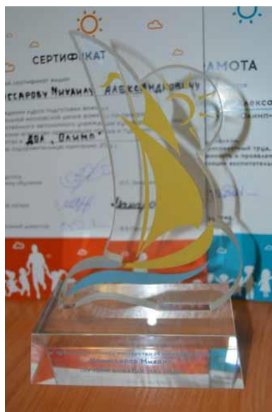
Награды за отличную работу