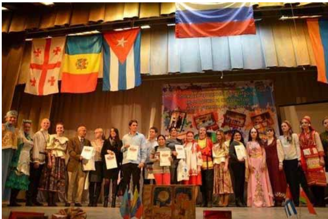
Участники фестиваля на сцене актового зала