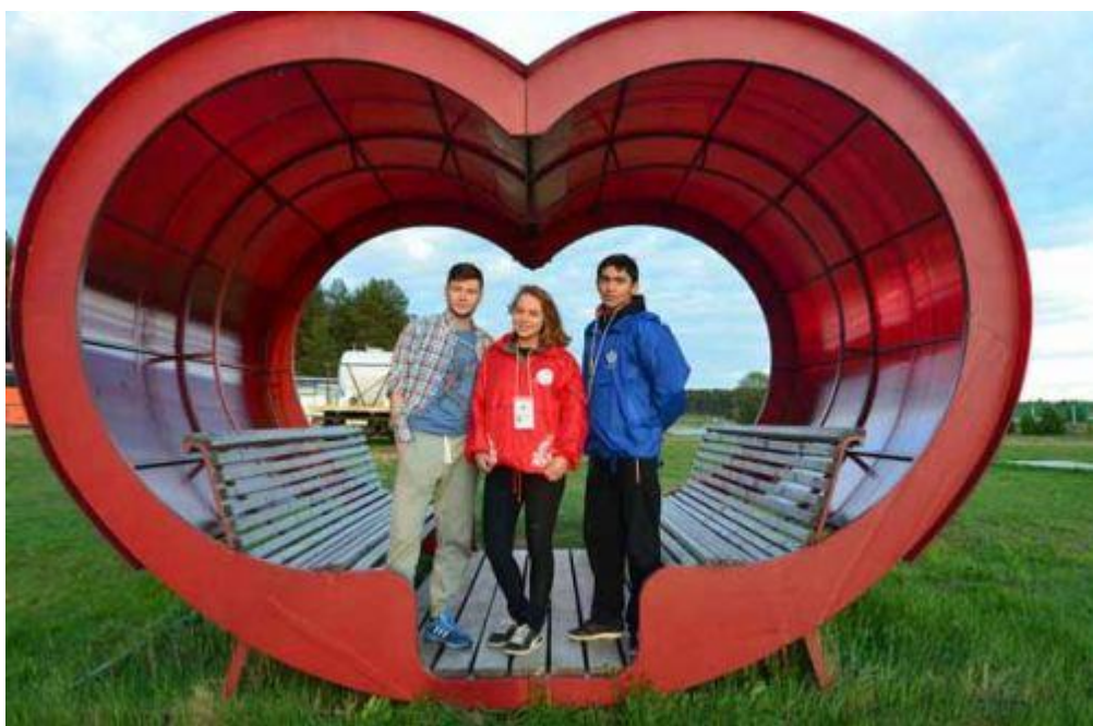
Фестиваль – место встречи с друзьями