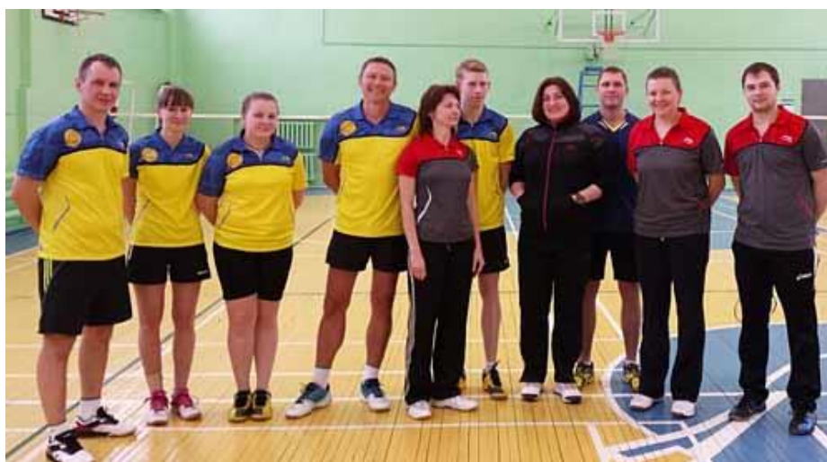
Команды спортклуба ГГХПИ и филиала МФТИ