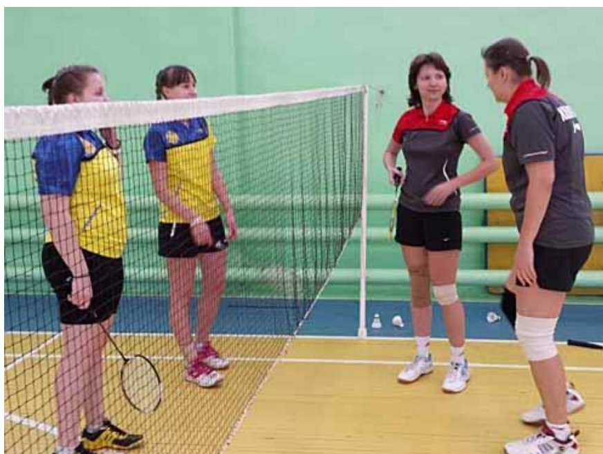
Перед началом игры

Всероссийский турнир по бадминтону "Рождественские встречи"