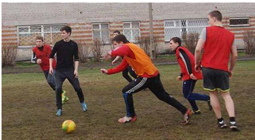
Атака на футбольном поле