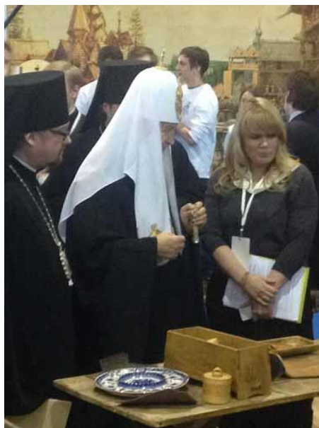
В числе изделий народных промыслов, представленных Патриарху Кириллу, работа студентов нашего института