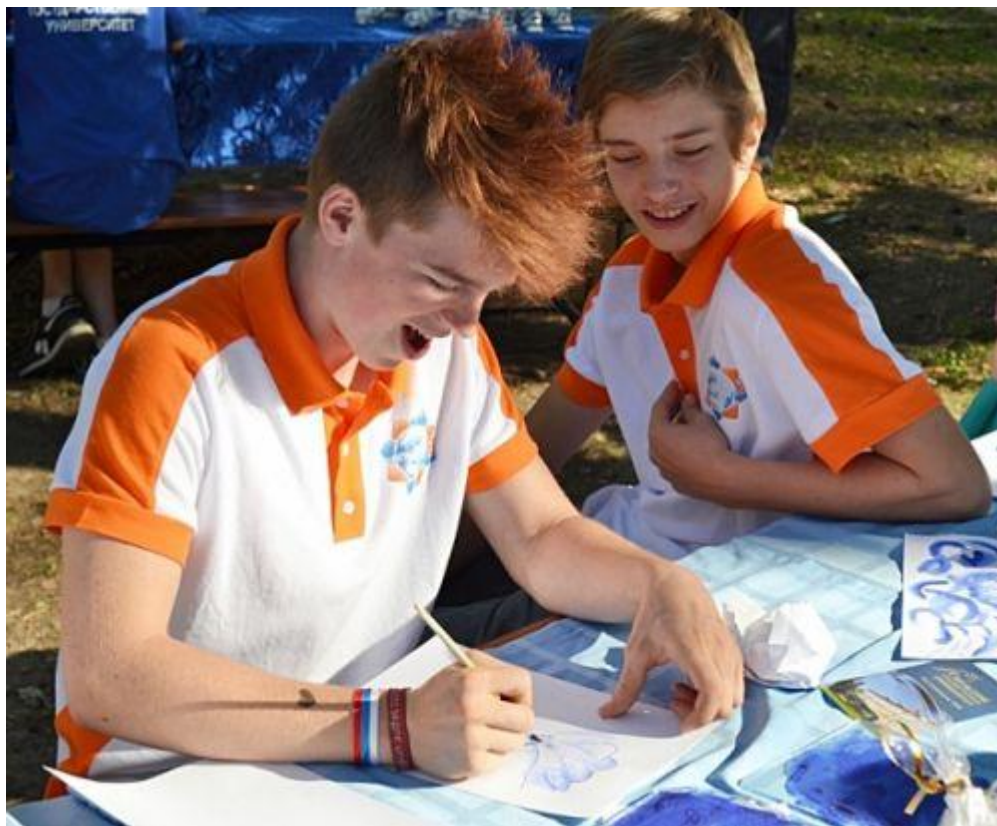
Школьники из Германии осваивают технику гжельской росписи