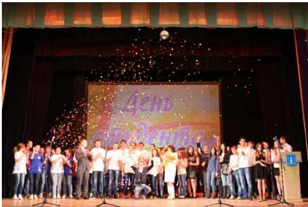
Студенты учебных заведений Раменского района принимают поздравления