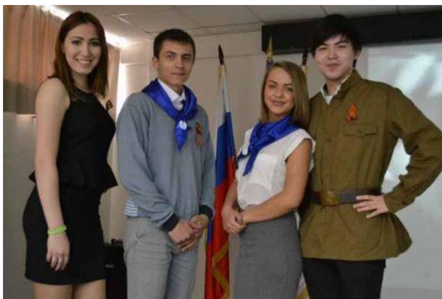
Конференция – это еще и возможность установить контакты