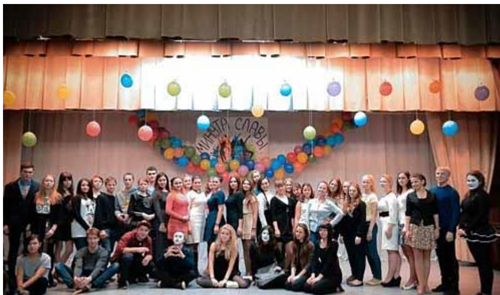
Участники конкурса на сцене актового зала института