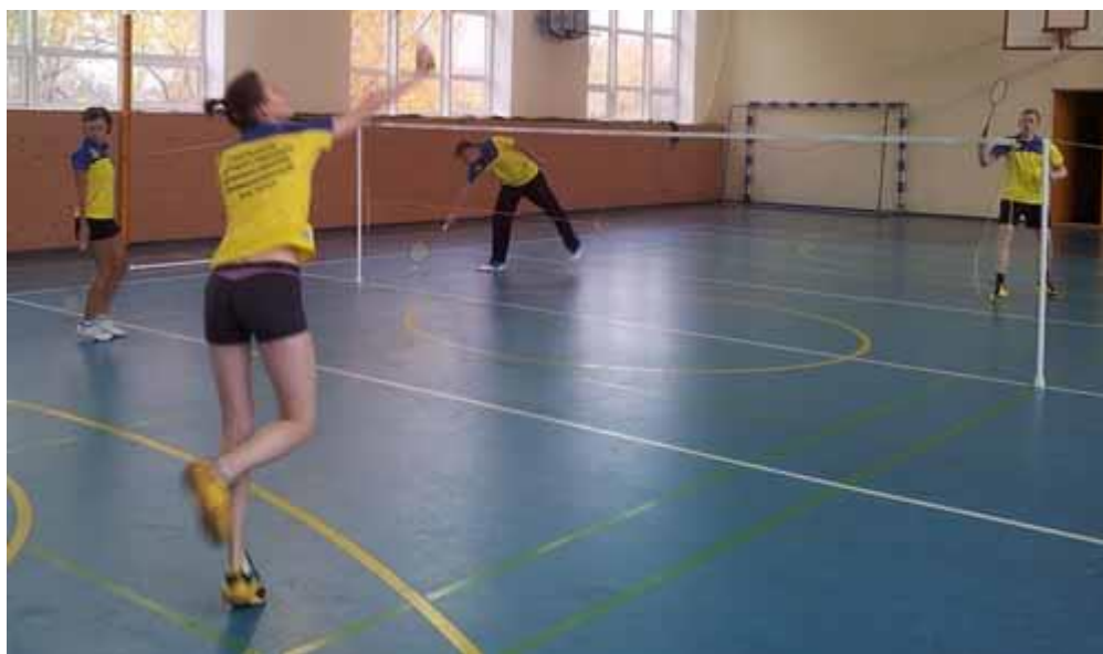
Спортсмены ГГХПИ (слева) и их соперники перед началом соревнований