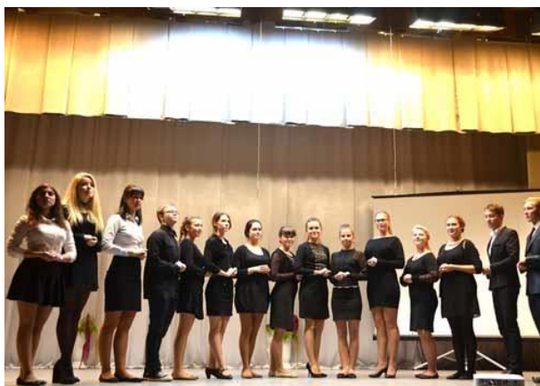
На сцене - вокальный ансамбль «Хорошая история»