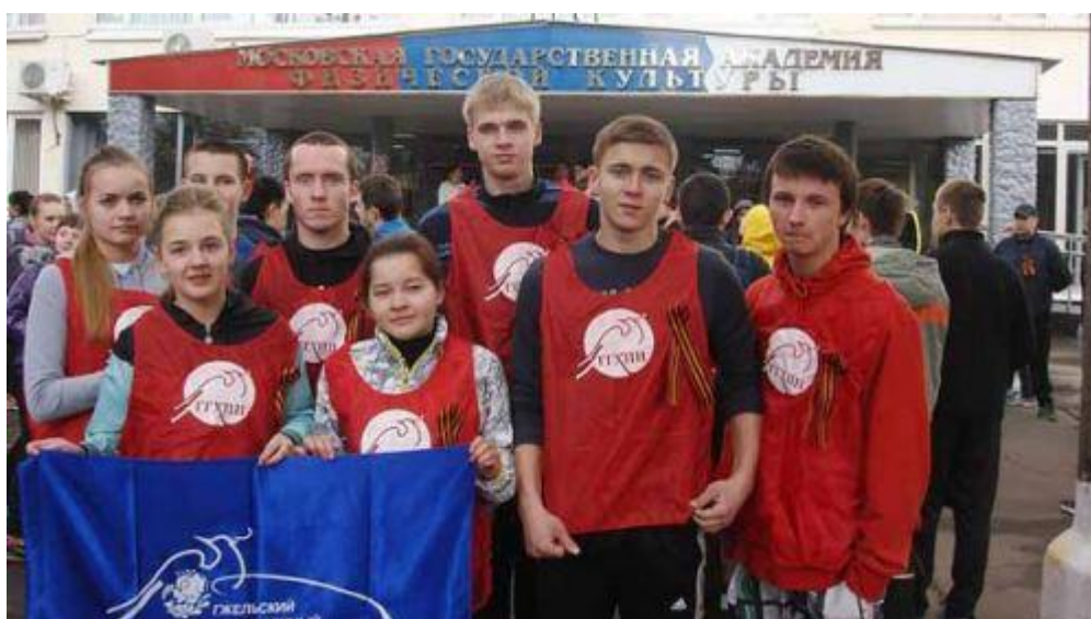
Команда ГГХПИ на легкоатлетическом кроссе спартакиады профсоюзов Московской области среди высших учебных заведений