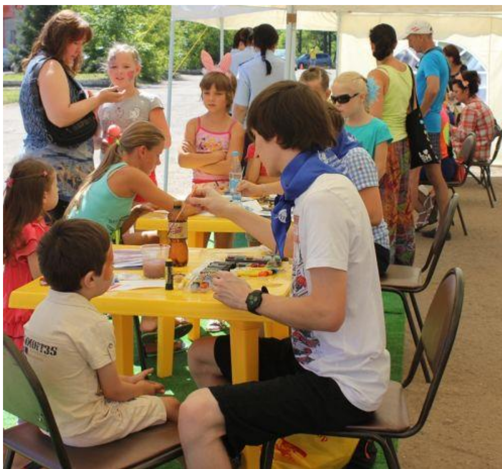
Мастер-класс по аква-гриму