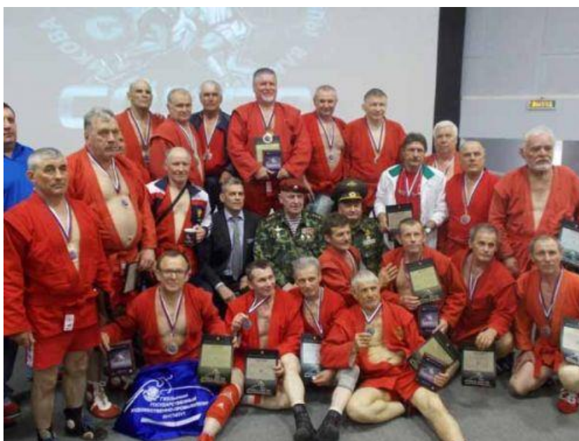
Спортсмены старших возрастных групп – чемпионы и призеры соревнований