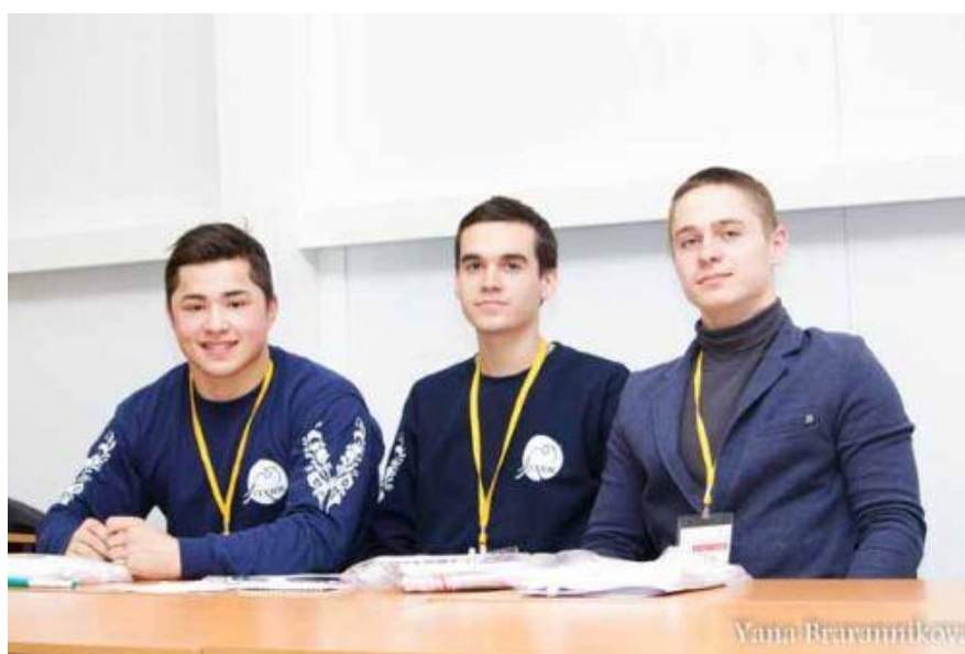
Во время занятий

Теперь участники семинара знают, как сделать помощь инвалидам более эффективной.