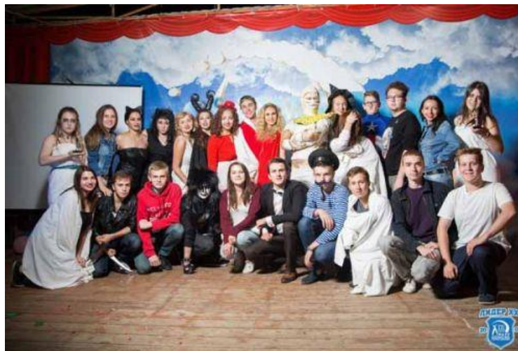
Участники театрализованного представления в школе студенческого актива