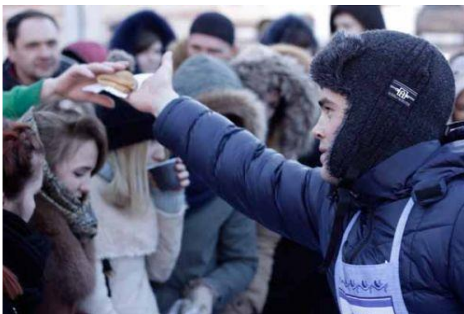
Угощение. Сладкие блины и горячий чай