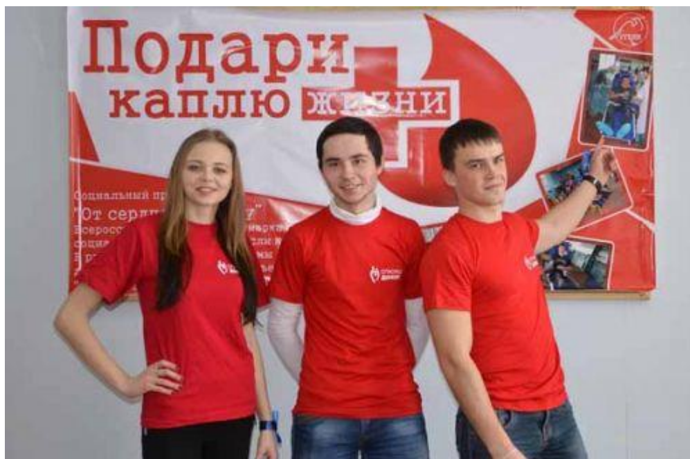
Медицинским работникам помогал отряд волонтеров ГГХПИ