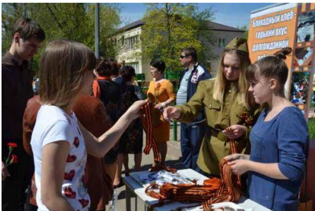
Студенческий совет провел акции «Блокадный хлеб» и «Георгиевская ленточка»