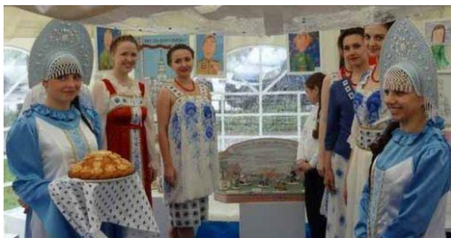
Подготовка к встрече гостей