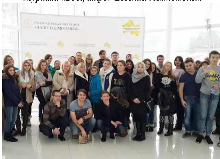
Участники семинара «Молодежные СМИ» IV первенство ГГХПИ по самбо