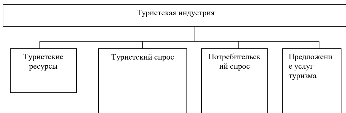
Рис. 1 Функциональная схема туристского рынка

Если иллюстрации имеют наименование и пояснительные данные (подрисуночный текст), то слово «Рис.» и наименование помещают после пояснительных данных и располагают следующим образом: