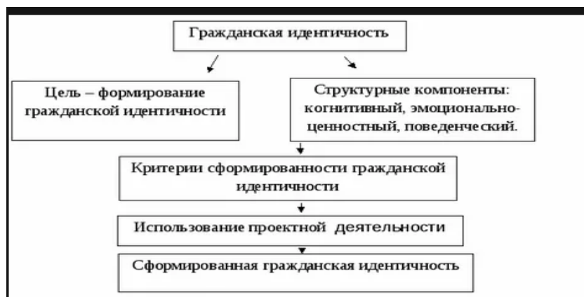
Рис. 1 Гражданская идентичность

Если иллюстрации имеют наименование и пояснительные данные (подрисуночный текст), то слово «Рис.» и наименование помещают после пояснительных данных и располагают следующим образом: