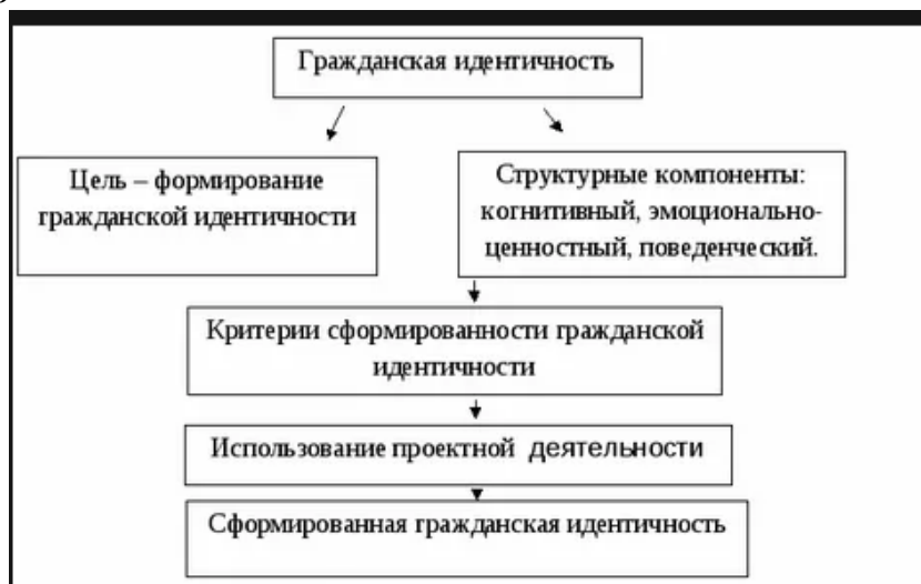
Рис. 1 Гражданская идентичность

Если иллюстрации имеют наименование и пояснительные данные (подрисуночный текст), то слово «Рис.» и наименование помещают после пояснительных данных и располагают следующим образом: