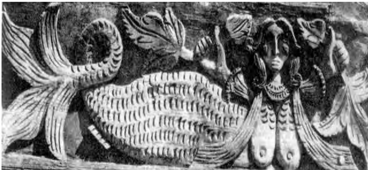
Рисунок 1.1. Русалка. Фрагмент резьбы на доме в Нижегородской губернии

При оформлении иллюстрации в виде графиков и диаграмм следует учитывать, что помимо графического изображения они в зависимости от их типа должны содержать следующие вспомогательные элементы: