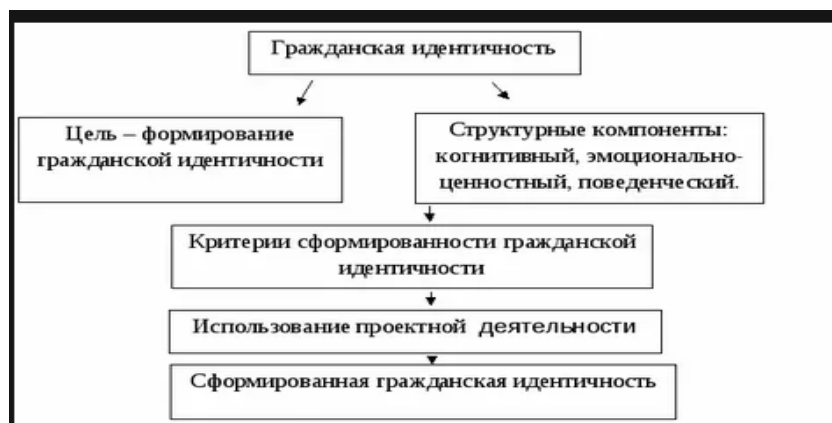
Рис. 1 Гражданская идентичность

Если иллюстрации имеют наименование и пояснительные данные (подрисуночный текст), то слово «Рис.» и наименование помещают после пояснительных данных и располагают следующим образом: