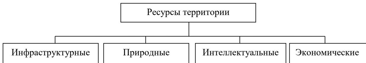
Рис. 1 Функциональная схема ресурсов территории

Если иллюстрации имеют наименование и пояснительные данные (подрисуночный текст), то слово «Рис.» и наименование помещают после пояснительных данных и располагают следующим образом: