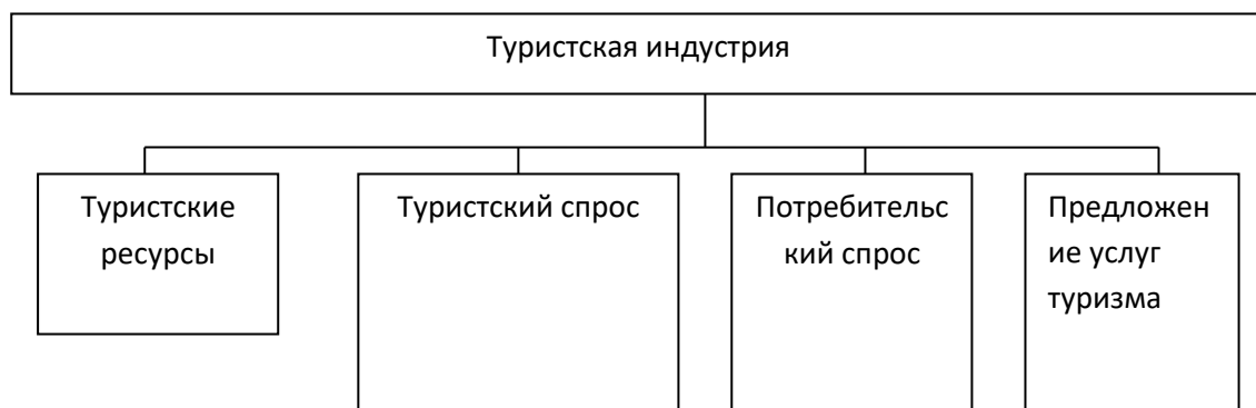
Рис. 1 Функциональная схема туристского рынка