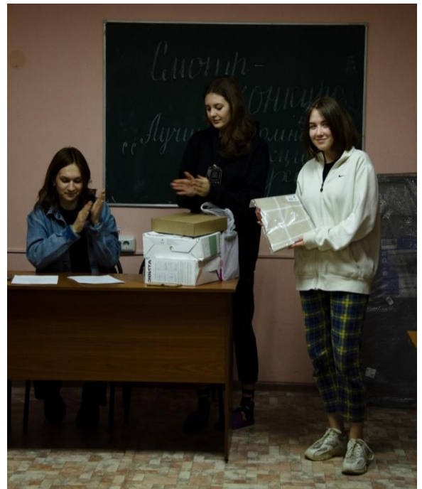
Пресс-центр общежития №3

кухнях, и о секциях, победивших в конкурсе. Все победители получили ценные подарки.